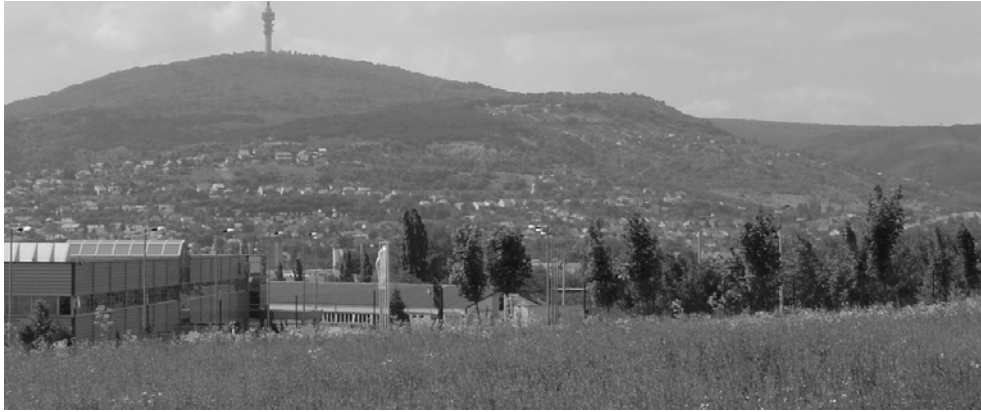
5. ábra. A sűrűn beépített pécsi területek, foghíjtelkek, illetve a külsőbb kertek legjellemzőbb fajai az Armadillidium vulgare , a Porcellio scaber , a Cylisticus convexus és a hangyavendég Platyarthus hoffmannseggii , de panellakásokban az ázsiai eredetű, nagy termetű Protracheoniscus major faj is él.

Fig. 5. The most common Isopoda species of densely inhabited residential areas, empty building zones and suburban gardens are Armadillidium vulgare , Porcellio scaber , Cylisticus convexus and the myrmecophilus Platyarthus hoffmannseggii . The large bodied, Asian species Protracheoniscus major is known from blocks of flats in dense residential areas.