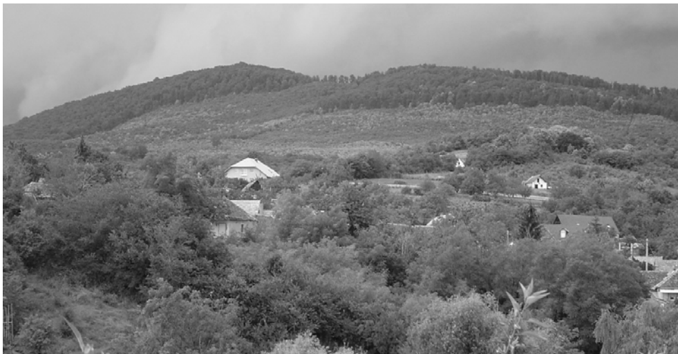
6. ábra. A Mecsekben legjellemzőbbek a cseres- és gyertyános tölgyesek, valamint a magasabb térszíneken és északi oldalakon álló bükkösök. A felsorolt élőhelyeken tömegesen fordul elő két tipikusan erdőlakó faj a Protracheoniscus politus és a Trachelipus ratzeburgii .

Fig. 5. The most common Isopoda species of densely inhabited residential areas, empty building zones and suburban gardens are Armadillidium vulgare , Porcellio scaber , Cylisticus convexus and the myrmecophilus Platyarthus hoffmannseggii . The large bodied, Asian species Protracheoniscus major is known from blocks of flats in dense residential areas.