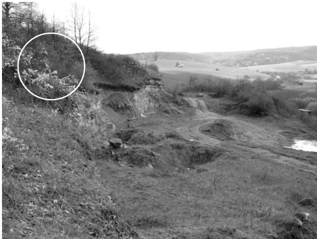
2. ábra. A Mecsekben a komlói Mecsekjános Természeti Emlék védett területéről (fehér kör) került elő a mediterrán Proporcellio vulcanius faj